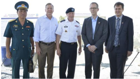
General Dempsey Project visit

U.S. General Martin Dempsey, Chairman of the Joint Chiefs of Staff, visited the Project site on August 15. General Dempsey hailed the project as an important milestone in the bilateral relationship and for the people of Danang: he stated, "I am so impressed with the progress being made. The U.S. Defense Department fully supports, and will continue to support this important initiative."