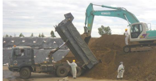
Stockpiling Phase 2 material

With the Danang rainy season quickly approaching, remaining excavation activities have been suspended until the 2015 dry season. Preparations have begun to secure the site for the rainy season, including several erosion control measures.