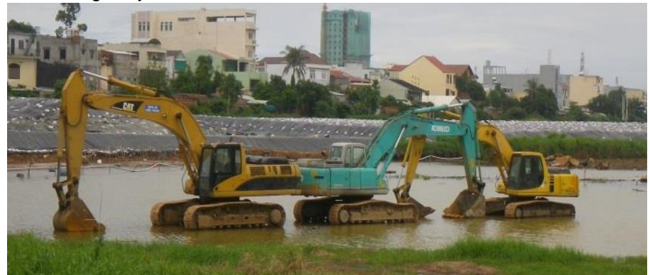
Sen Lake after heavy rain

The temporary stockpiles will be maintained and monitored for the duration of the Danang rainy season.