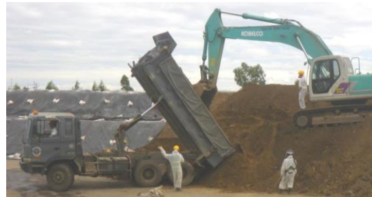
Tập kết vật liệu Giai đoạn 2