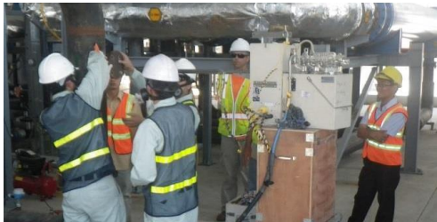
CPVN lấy mẫu hơi từ dòng chảy ra của hệ thống xử lý

Các nhà thầu của USAID quan trắc, kiểm tra và thử nghiệm rộng rãi môi trường (không khí, nước, đất) nhằm bảo vệ môi trường cùng sức khỏe và an toàn của cộng đồng bên ngoài vùng Dự án. Phối hợp chặt chẽ với các nhà thầu của USAID, Bộ Quốc phòng Việt Nam cũng thực hiện quan trắc độc lập các hoạt động của Dự án đối với đất,