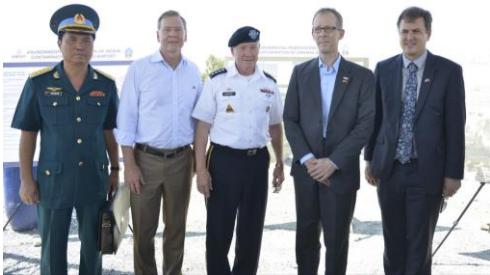
Tướng Dempsey đến thăm Dự án

Vào ngày 15 tháng 8, Đại tướng Martin Dempsey, Chủ tịch Hội đồng Tham mưu Liên quân Hoa Kỳ đã đến thăm công trường Dự án. Đại tướng Dempsey ca ngợi Dự án như là một cột mốc quan trọng trong mối quan hệ hợp tác song phương và đối với cư dân Đà Nẵng. Ông cho biết, "Tôi có ấn tượng sâu sắc với tiến độ đã đạt được. Bộ Quốc phòng Hoa Kỳ hoàn toàn ủng hộ và sẽ tiếp tục hỗ trợ sáng kiến quan trọng này."