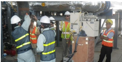
GVN collecting vapor samples from treatment system effluent

USAID contractors conduct extensive monitoring, inspection and testing of environmental media (i.e., air, water, soil) to protect the environment and health and safety of the community outside the Project site. In close coordination with USAID, the Vietnamese Ministry of National Defense also conducts its own independent soil, air and water monitoring of Project activities.